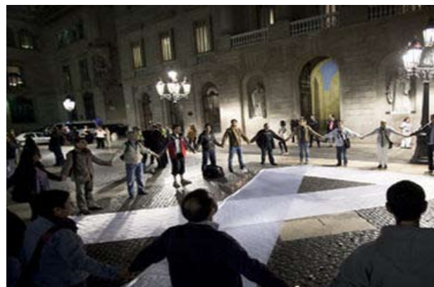
La Roda d’Homes celebrada a la plaça Sant Jaume de Barcelona el passat 21 d’octubre.

E l passat 21 d’octubre els homes van tornar a sortir al carrer per mostrar el seu rebuig a la violència cap a les dones. Aquest dia tots els grups d’homes igualitaris de tot Espanya surten al carrer i formen una roda amb aquest motiu. Les Rodes d’Homes són actes simbòlics en els quals els homes es manifesten públicament contra la violència de gènere, entenent que la violència de gènere no pot ser un problema de les víctimes que la pateixen, sinó que és un problema que afecta a tota la societat. Alguns membres de la nostra Federació van participar també en la roda d’aquest any a Barcelona.