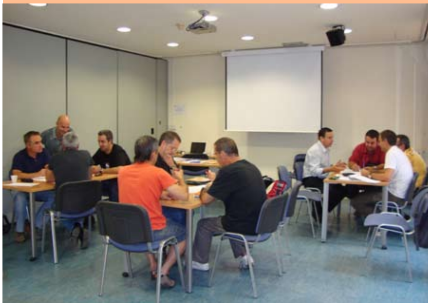
Un moment del curs sobre igualtat de gènere impartit a un grup d'homes de la FSC.

Uns quants homes voluntaris de la nostra Federació, conscienciats i interessats en la igualtat entre els gèneres, s'han format durant diverses setmanes en matèria d'igualtat de gènere, en un curs impulsat des de la Secretaria de la Dona. Un grup de dones ha rebut també una formació i ara estem començant un camí plegats que ens ha de servir perquè la transversalitat de la que tant parlem en els plans de treball i en la col·laboració entre l'estructura, sigui real i efectiva. És el que hem batejat com a Projecte “Acció Igualitària” a la FSC.